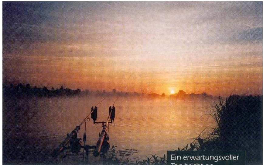
Ein erwartungsvoller Tag bricht an.

Wie schon angesprochen, beherbergt der Altmühlsee seine bekannten Vogelinseln, die, wie es sich gehört, zum NSG erklärt worden sind. Sie nehmen gut ⅓ der Seefläche ein und sind mit Bojen markiert, die zeigen, wie weit man sich ihnen auf dem Wasser nähern darf. Rund um das NSG am See befinden sich Hinweistafeln, die darüber Auskunft geben, welche Gebiete man betreten darf, bzw. was untersagt ist. Gut die Hälfte des Sees wird durch Scharen von Surfern, Seglern und Badegästen heimgesucht, und an windigen und auch an sonnigen Tagen bevölkert. Deshalb suchten wir gleich den ruhigeren Seeteil auf.