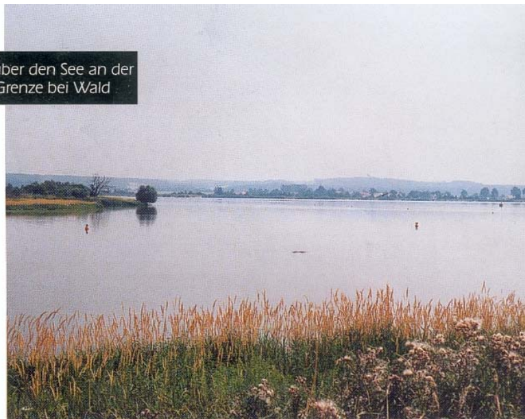
Blick über den See an der NSG-Grenze bei Wald